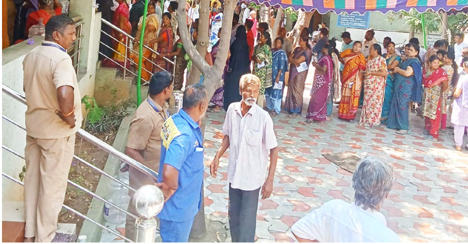
■ ஈரோடு மேற்கு சட்டமன்ற தொகுதிக்கு உட்பட்ட அரசு தொடக்கப் பள்ளியில் ஆண்கள் ஆண்கள் ஆண் மற்றும் பெண் வாக்காளர்கள் வரிசையில் நின்று தங்களது ஜனநாயக கடமையாற்றினார்கள்