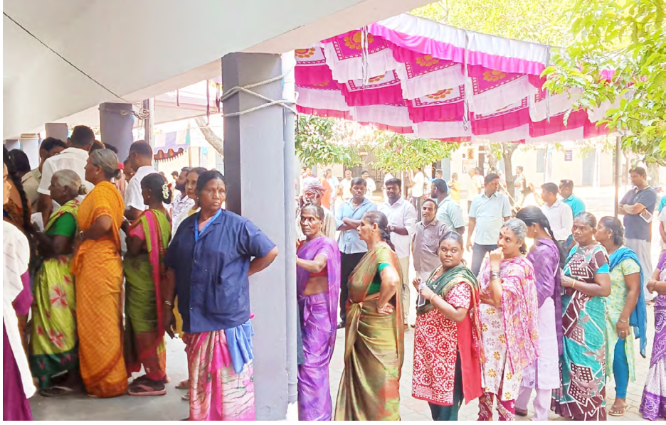
■ மொடக்குறிச்சியில் அரசு ஆண்கள் மேல்நிலைப் பள்ளியில் ஆண்கள் மற்றும் பெண்கள் நீண்டவரிசையில் காத்திருந்து தங்கள் ஜனநாயக கடமையை ஆற்றினார்கள்