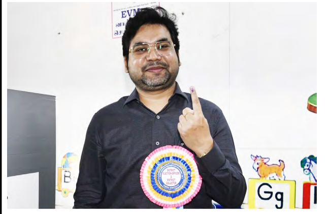
■ தமிழ்நாடு சட்டமன்றப் பொது தேர்தல் 2026 முன்னிட்டு வாக்குப்பதிவு நாளான தேனி மாவட்டம் 199 பெரியகுளம் சட்டமன்ற தொகுதிக்குட்பட்ட வட புதுப்பட்டி முத்தாலம்மன் இந்து மேல்நிலைப்பள்ளி வாக்குச்சாவுடி மையத்தில் மாவட்ட ஆட்சித்தலைவர் ரகுசித் சிங் வாக்குப்பதிவு செய்தார்