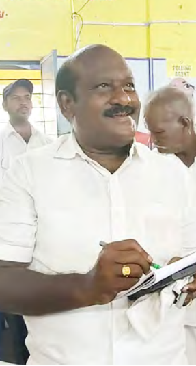
அனைத்து வாக்குச் சாவடி களுக்கும் சென்று வாக்காளர்கள்

சென்னை, ஏப்.24- தேர்தல் ஆணையத்தின் நெறிமுறையை அறிந்து விஜய் கோரிக்கை வைத்தால் நியாயமாக இருக்கும் என உயர் கல்வித்துறை அமைச்சர் கோவி.செழியன் தெரிவித்துள்ளார்.