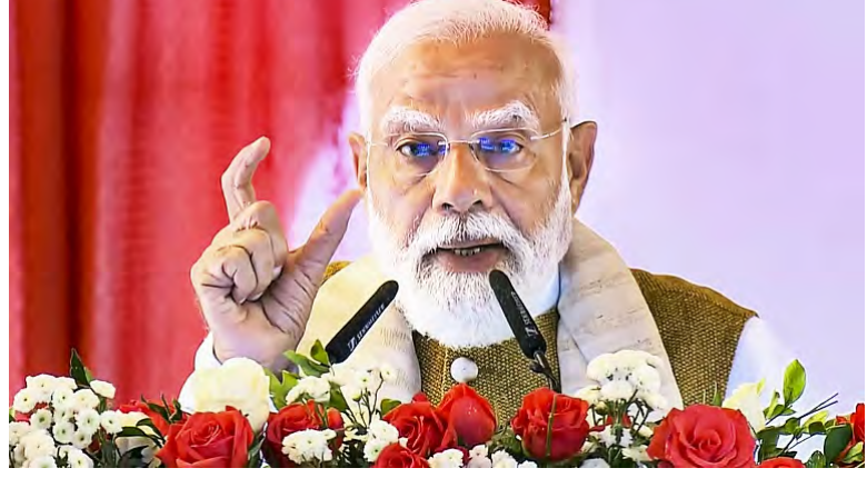
உண்மை இல்லை. வெளிநாட்டுப் பயணங்களுக்கு இதுபோன்ற கட்டுப்பாடுகளை விதிக்கும் கேள்விகே இடமில்லை. நமது மக்கள் வணிகம் மேற்கொள்வதை எளிதாக்குவதையும், வாழ்வதை எளிதாக்குவதையும் மேம்படுத்துவதில் நாங்கள் உறுதியாக இருக்கிறோம்” என்று தெரிவித்துள்ளார். ஒரு ஊடகச்

புது டெல்லி: மே.17- வெளிநாட்டுப் பயணங்களுக்கு வரி அல்லது கூடுதல் கட்டணம் விதிப்பது குறித்து மத்திய அரசு பரிசீலித்து வருவதாக வெளியான ஊடக செய்தி முற்றிலும் பொய்யானது என்று பிரதமர் மோடி தெரிவித்துள்ளார். வெளிநாட்டுப் பயணங்களுக்கு வரி, செல் அல்லது கூடுதல் கட்டணம் விதிப்பது குறித்து மத்திய அரசு பரிசீலித்து வருவதாகவும், ஆனால் இறுதி முடிவு எதுவும் இன்னும் எடுக்கப்படவில்லை என்றும் ஊடக நிறுவனம் ஒன்று செய்தி வெளியிட்டது. இதற்கு மறுப்பு தெரிவித்து பிரதமர் மோடி வெளியிட்ட எக்ஸ் பதிவில், ‘இந்த செய்தி முற்றிலும் பொய்யானது. இதில் ஒரு துளிகூட