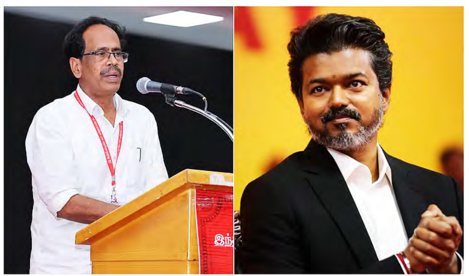
பிஎம்ஸூ திட்டத்தை தவிர அரசு நிராகரிக்க முதல்வர் விஜய்க்கு இந்திய கம்யூ. வலியுறுத்தல்