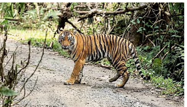
இந்நிலையில் (மே 16) காலை முதல் பேரிஜம் ஏரி பகுதியில் புலிகள் நடமாட்டம் இருப்பது கண்டறியப்பட்டது. இதனால் பாதுகாப்பு கருதி செல்வதற்கு சனிக்கிழமை (இன்று) காலை முதல் மறு அறிவிப்பு வரும் வரை வனத்துறை தடை விதித்துள்ளது. அதனால் சுற்றுலா பயணிகள் ஏமாற்றத்துடன் திரும்பி சென்றனர். இது குறித்து வனத்துறையினர் கூறும் போது, புலிகள் நடமாட்டத்தை தொடர்ந்து கண்காணித்து வருகிறோம். புலிகள் அடர்ந்த வனப்பகுதிக்குள் சென்றது மட்டுமே சுற்றுலாப் பயணிகள் அனுமதிக்கப்படுவர் என்றனர்.

திண்டுக்கல்: மே.17- கொடைக்கானல் பேரிஜம் ஏரி பகுதியில் புலிகள் நடமாட்டம் இருப்பதால் சனிக்கிழமை (நேற்று) காலை முதல் மறு அறிவிப்பு வரும் வரை சுற்றுலா பயணிகள் செல்ல தடை விதிக்கப்பட்டுள்ளது. திண்டுக்கல் மாவட்டம் கொடைக்கானல் உள்ள முக்கிய சுற்றுலா தலங்களில் பேரிஜம் ஏரி பாதுகாக்கப்பட்ட வனப்பகுதியில் உள்ளது. இதனால் வனத்துறையினரிடம் அனுமதி பெற்றே சுற்றுலாப் பயணிகள் செல்ல முடியும். பேரிஜம் ஏரிக்கு செல்லும் வழியில் தொப்பி தூக்கிப் பாறை, மதிக்கெட்டான சோலை, வியூ பாய்ண்ட், அமைதி பள்ளத்தாக்கு உள்ளிட்ட இடங்களை பார்க்கலாம்.