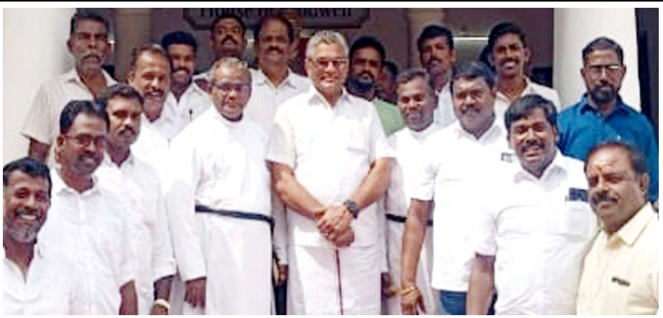
■ திருநெல்வேலி மாவட்டம் ராதாரம் ஒன்றியம் இடையன்குடியில் பிஷப் கால்டுவெல்லின் 212 ஆவது பிறந்த தின விழாவை முன்னிட்டு, அவரது திருவருவச் சிலைக்கு திமுகவினர் மாலை அணிவித்து மரியாதை செலுத்தினர்.