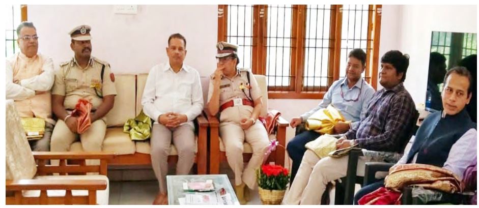
■ புதுச்சேரி முதல்வர் ரங்கசாமியின் இல்லத்தில் தலைமைச் செயலர் மற்றும் அனைத்து துறை செயலர்கள், டிஜிபி, டிஜிஜி உள்ளிட்ட அதிகாரிகள் சந்திக்க காத்திருக்கின்றனர்*