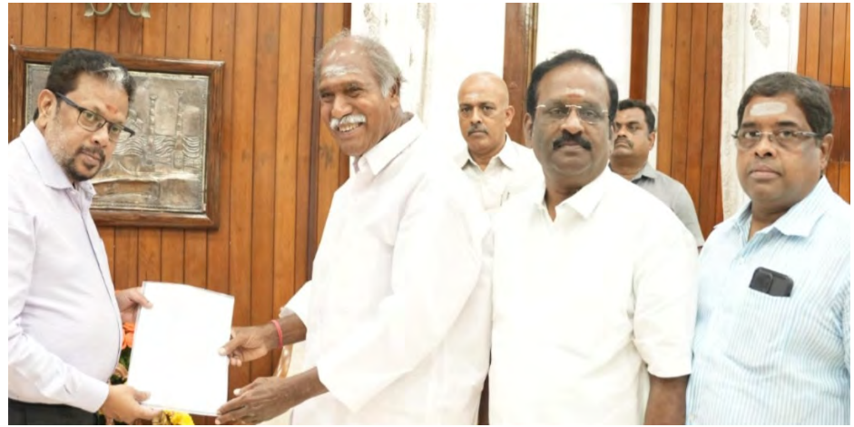
■ முதல்வர் ரங்கசாமி துணைநிலை ஆளுநர் கைலாஷ்நாதனை சந்தித்து தனது ராஜினாமா கடிதத்தை அளித்து, மீண்டும் ஆட்சியமைக்க உரிமை கோரினார்.