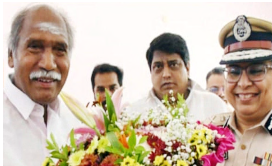
■ முதலமைச்சர் ரங்கசாமியை தலைமை செயலர், டிஜிபி, அரசு செயலர்கள், காவல்துறையர் அதிகாரிகள் மரியாதை நிமித்தமாக சந்தித்து வாழ்த்து தெரிவித்தனர்.