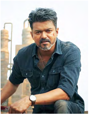
அதிர்ச்சியில் ஆழ்த்தியது. தற்போது தமிழக தேர்தலில் வெற்றி பெற்று முதல்வராக பொறுப்பேற்க உள்ளார் தவெக தலைவர் விஜய். இதனை முன்வைத்து 'ஜனநாயகன்' தணிக்கை சர்ச்சை முடிவுக்கு வரும் என விநியோகஸ்தர்கள்

சென்னை மே 06- 'ஜனநாயகன்' வெளியீட்டு சர்ச்சை முடிவுக்கு வருமா என்று விநியோகஸ்தர்கள் ஆவலுடன் எதிர்நோக்கி இருக்கிறார்கள். ஹெச்.வினோத இயக்கத்தில் விஜய் நடித்துள்ள படம் 'ஜனநாயகன்'. ஜனவரி 9ம் தேதி வெளியீட்டுக்கு திட்டமிடப்பட்ட இப்படம் தணிக்கை பிரச்சினையில் சிக்கியது. இதனால் இப்போது வரை தணிக்கை சான்றிதழ் கிடைக்காமல், வெளியீட்டு தேதி முடிவு செய்யப்படாமல் உள்ளது. மேலும், சில தினங்களுக்கு முன்பு இப்படம் இணையத்தில் வெளியாகி படக்குழுவினரை