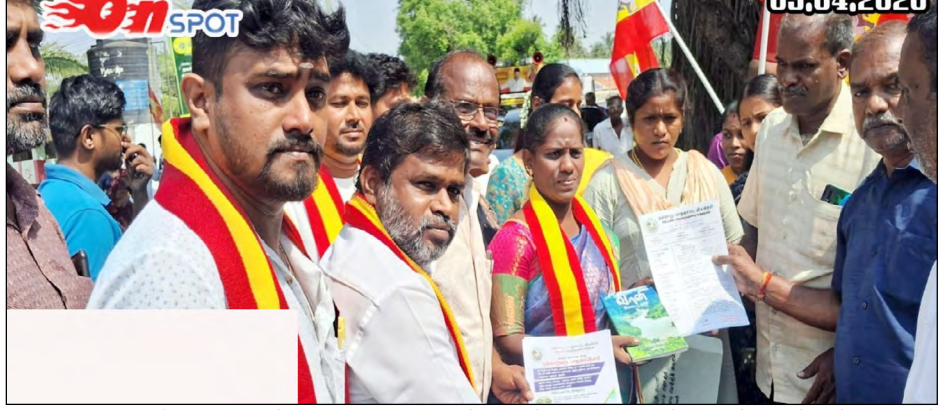
■ மக்களின் தாகம் தீர்க்கும் நல்லாறு நதியை மீட்டெடுக்க வலியுறுத்தி, அவிநாசி தொகுதி தவெக வேட்பாளர் கமலிவிடம் நல்லாறு பாதுகாப்பு இயக்கத்தினர் சார்பாக கோரிக்கை மனு அளிக்கப்பட்டது.