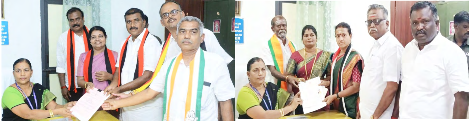
திமுக வேட்பாளர் மார்க்

பிரச்சினைகளையும் போராட்டங்களையும் நான் மிக நெருக்கமாகக் காண்கிறேன். நான் சந்திக்கும் மக்கள் அனைவரும் நல்ல கல்வித் தகுதி பெற்றவர்கள். கேரளாவில் நன்கு படித்த இளைஞர்களுக்கு வேலை வாய்ப்புகள் இருப்பதில்லை; அப்படியே வேலை கிடைத்தாலும், அந்த வேலைகள் மாநிலத்துக்கு வெளியேதான் உள்ளன. கேரளாவுக்குள் வேலை வாய்ப்புகள் குறைவாக இருப்பதால், மக்கள் இடம்பெயர வேண்டிய கட்டாயம் ஏற்படுகிறது” என்று கூறினார். 2026 கேரள சட்டப்பேரவைத் தேர்தல் ஏப்ரல் 9 அன்று நடைபெற உள்ளது. வாக்கு எண்ணிக்கை மே 4 அன்று நடைபெறுகிறது.