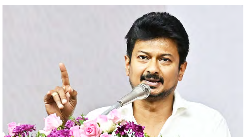
தொடங்குவோம். மக்களை ஒவ்வொரு நாளும் முதல்வர் தொடர்ந்து சந்தித்துக் கொண்டுதான் இருக்கிறோம். கடந்த 5 ஆண்டுகளாக உறுப்பினர்கள் தொடர்ந்து

தாத்துக்குடி: மார்ச்-8- “கடந்த தேர்தலில் சேப்பாக்கம் திருவல்லிக்கேணி தொகுதியில் போட்டியிட்டேன். தற்போது திமுக தலைவர் என்ன முடிவு எடுக்கிறாரோ, அந்த தொகுதியில் போட்டியிடுவேன்” என்று துணை முதல்வர் உதயநிதி ஸ்டாலின் தெரிவித்தார். தாத்துக்குடியில் அவர் இன்று செய்தியாளர்களிடம் கூறியது: “தேர்தலை முன்னிட்டு கட்சி நிர்வாகிகள் சந்திப்பை நடத்தி முடித்துள்ளோம். நாளை திருச்சியில் முதல்வர் மு.க.ஸ்டாலின் தலைமையில் மாநாடு நடைபெற உள்ளது. திமுக தலைவர் அறிவித்த பின்னர் தேர்தல் பிரச்சாரத்தை