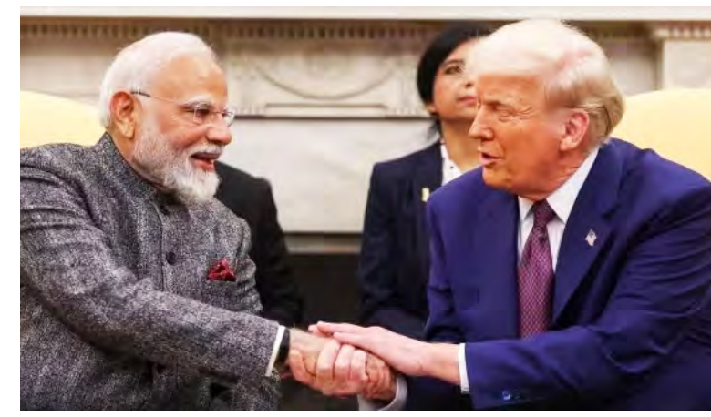
ஹார்முஸ் ஜலசந்தியை நாடுகளில் உள்ள நிலவரம் குறித்து திறந்தே வைத்திருப்பதன் அவர்கள் கலந்துரையாடினர். முக்கியத்துவம், மத்திய கிழக்கு இச்சூழலில், இந்தியாவுடனான

புதுடி: மார்ச்-28-மற்றவர்களைப் போல இல்லை. பிரதமர் மோடியும், நானும் காரியங்களை செய்து முடிப்பவர்கள் என பிரதமர் மோடியை அமெரிக்க அதிபர் டிரம்ப் பாராட்டி உள்ளார். மேற்கு ஆசியாவில் போர் நடைபெற்று வரும் சூழலில், ஹார்முஸ் ஜலசந்தியை ஈரான் முடியிருக்கிறது. கப்பல் போக்குவரத்து தடைபட்டு சர்வதேச அளவில் எண்ணெய் வர்த்தம் பாதிக்கப்பட்டு உள்ளது. கடந்த 24ம் தேதி அமெரிக்க அதிபர் டிரம்ப், நமது பிரதமர் மோடியுடன் மேற்கு ஆசியா போர் தொடர்பாக போனில் பேசினார்.