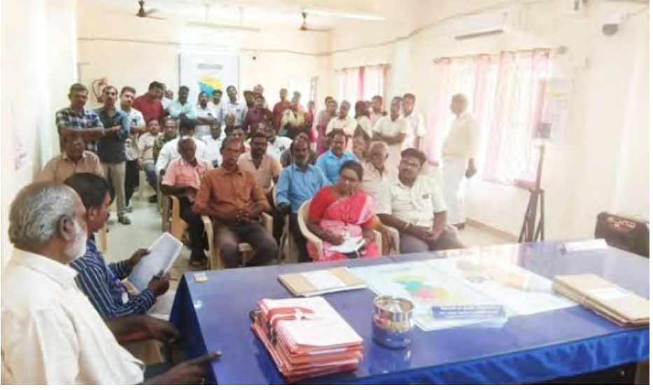
189 தேர்தல் நடத்தும் அலுவலர் மற்றும் வட்டாட்சியர் இந்திய தேர்தல் ஆணையத்தால் தமிழ்நாடு சட்டமன்ற தேர்தலுக்கான கால அட்டவணை அறிவிக்கப்பட்டதை தொடர்ந்து தேர்தல் நடத்தை விதிமுறைகள் அமலில் உள்ளது. இந்திய தேர்தல் ஆணையம் கத்திரமான நியாயமான தேர்தல் நடைபெறுவதை உறுதி செய்து விடவும் தேர்தல் பிரச்சாரத்தின் போது சமமான, ஆரோக்கியமான போட்டியிடும் சூழலை அனைத்து வேட்பாளர்களுக்கிடையே உருவாக்கி டவும் பணம் / பொருள் மூலமாக வாக்காளர்களுக்கு தேவையற்ற செல்வாக்கினை செலுத்துவதை தடுத்திடவும் பல்வேறு அறிவுரைகள் கட்டுப்பாடுகளை விதித்துள்ளது.