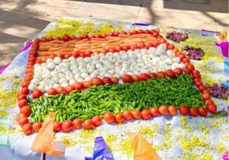
மதுரை அண்ணாநகர் உழவர் சந்தையில் பொதுமக்களிடையே தேர்தல் விழிப்புணர்வு ஏற்படுத்தும் வகையில் மலர்கள் மற்றும் காங்கறிகளை கொண்டு விழிப்புணர்வு ஏற்படுத்தப்பட்டது.

விளம்பரம் மற்றும் செய்திகள் தொடர்புக்கு : 88705 00000