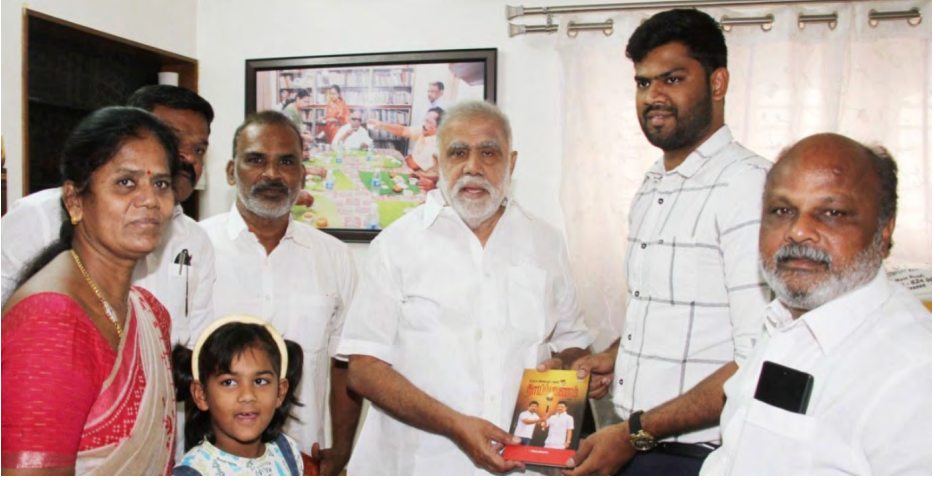
'நான் முதல்வன்' திட்டத்தால் உயர்ந்த ஏழை மாணவன்; நெகிழ்ச்சியில் அமைச்சர் ஐ.பெரியசாமி