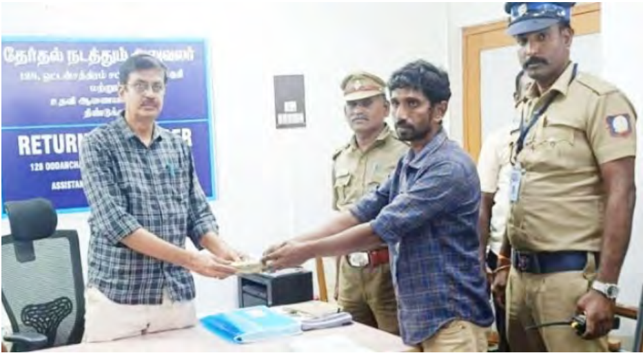
*திண்டுக்கல் மாவட்டம் ஒட்டன்சத்திரம் சட்டமன்ற தொகுதியில் FST 1B பறக்கும் படை குழுவினரால் மாட்டுப் பாதை அருகில் எவ்வித ஆவணங்கள் இல்லாமல் கொண்டு செல்லப்பட்ட ரூ.93,000 பணத்தை கைப்பற்றி, ஒட்டன்சத்திரம் வட்டாட்சியர் அலுவலகத்தில் உதவி தேர்தல் நடத்தும் அலுவலரிடம் ஒப்படைத்தனர்

அச்சிடப்பட்டிருந்தன. இந்த வித்தியாசமான முயற்சியைக் கண்டு வியந்த உறவினர்களும் பொதுமக்களும் மணமக்களின் சமூக ஆர்வத்தைப் பாராட்டிச் சென்றனர். தேர்தல் களம் குடுபிடித்துள்ள நிலையில், திசையன்விளையில் நடந்த இந்த நூதனப் பிரச்சாரம் அந்தப் பகுதி முழுவதும் பெரும் வரவேற்பைப் பெற்றுள்ளது. "இல்லறம் தொடங்கும் இடத்தில் அறம் காப்போம்!" புதுவாழ்வைத் தொடங்கும் போதே தேசத்தின் கடமையை நினைவுட்டிய மணமக்களுக்கு "சக்கர விழுகம்" புலனாய்வு நாளிதழ் குழுமம் தனது மணமாந்த வாழ்த்துக்களை தெரிவித்துக் கொள்கிறது.