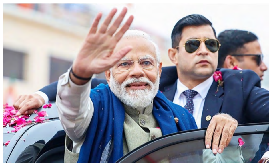
புதுச்சேரி பாஜக மற்றும் தேசிய ஜனநாயக கூட்டணி கட்சி வேட்பாளர்களை ஆதரித்து பிரச்சாரம் செய்வதற்காக, பிரதமர் மோடி வரும் ஏப்ரல் 3 ஆம் தேதி புதுச்சேரியில் வர உள்ளதாகவும், அப்போது அவர் ரோடு ஷோவில் பங்கேற்க உள்ளதாகவும் புதுச்சேரி மாநில பாஜக தலைவர் ராமலிங்கம் தகவல்.