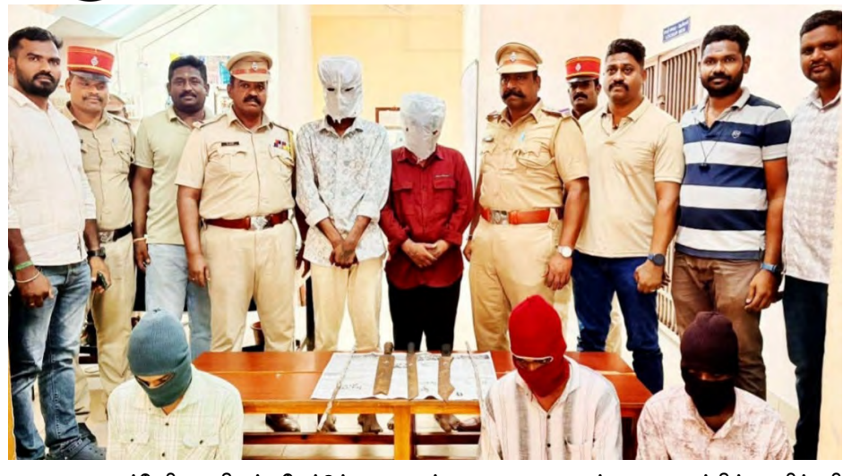
புதுச்சேரி மாநிலம் மேட்டுப்பாளையம் கரைக வாகனம் முனையத்தில் வழிப்பறி செய்யும் நோக்கத்தோடு, கத்தி மற்றும் இரும்பு பைப்புகள் வைத்திருந்த சாரம் மற்றும் நைனார் மண்டபத்தை சேர்ந்த 5 பேரை வடக்கு குற்றப்பிரிவு மற்றும் தன்வந்திரி நகர் போலீசார் கைது செய்து சிறையில் அடைத்தனர். மேலும் கைது செய்யப்பட்டவர்கள் மீது கொலை முயற்சி, கஞ்சா வழக்குகள் நிலுவையில் உள்ளது.