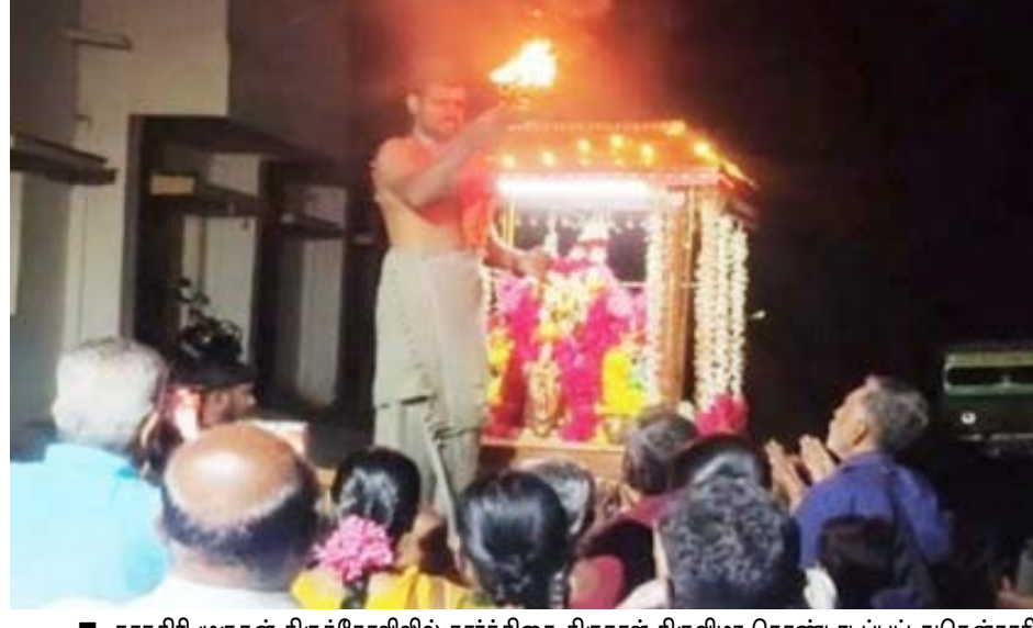
■ நாதகிரி முருகன் திருக்கோவில் கார்த்திகை திருநாள் திருவிழா கொண்டாடப்பட்டது. தென்காசி மாவட்டம் வாகதேவநல்லூர் வட்டம் நாதகிரி பாலகப்பிரமணியன் திருக்கோவில் கார்த்திகை திருநாள், முருகப்பெருமான சம்பரத்தில் கிரிவலம் சுற்றி வந்து சுவாமி தரிசனம் செய்து ஏராளமான பக்தர்கள் முருகப்பெருமானின் அருள் பெற்றனர்.