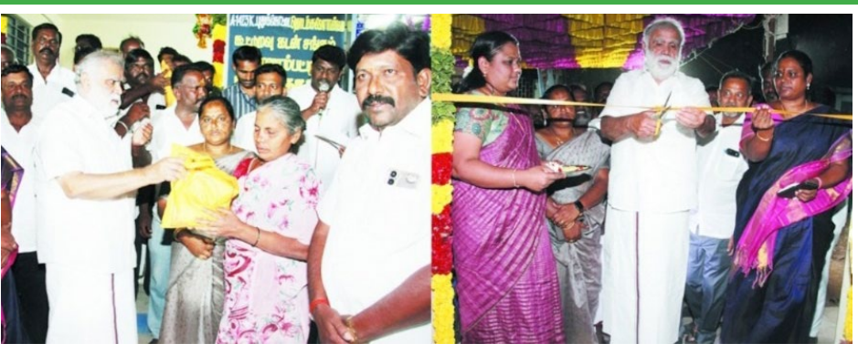
இன்று திறந்து வைத்தார். *அமைச்சர் உரையின் முக்கிய அம்சங்கள்:* முன்னதாக மக்கள் ரேஷன் பொருட்களை வாங்க 3 முதல் 5 கி.மீ. வரை நடந்து செல்லும் நிலை இருந்தது. தற்போது அவர்கள் வசிக்கும் பகுதியிலேயே கடைகள் அமைந்துள்ளதால் மக்கள் மகிழ்ச்சியடைந்துள்ளனர். ஊரக வளர்ச்சித் துறையின் மூலம் கட்டப்பட்டுள்ள இந்தப் புதிய கட்டிடங்களில் முழுநேரம் மற்றும் பகுதிநேரக் கடைகள் செயல்படுவதால், மாதம் முழுவதும் தடை யின்றி பொருட்கள் வழங்கப்படுகின்றன. நிகழ்ச்சியில்

ஆத்தூர், பிப்.16- ஆத்தூர் தொகுதியில் அனைத்து கிராமங்களிலும் நியாயவிலைக் கடைகள் திறக்கப்பட்டுள்ளதால், பொதுமக்கள் எவ்வித சிரமமுமின்றி ரேஷன் பொருட்களை வாங்கிச் செல்கின்றனர் என ஊரக வளர்ச்சித்துறை அமைச்சர் ஜ.பெரியசாமி தெரிவித்தார். திண்டுக்கல் மாவட்டம், ரெட்டியார் சத்திரம் ஒன்றியம், குருநாதநாயக்கனூர் ஊராட்சிக்குட்பட்ட மன்னார்கோட்டையில் ரூ.10 லட்சம் மதிப்பீட்டிலும், கதிர்மண்டலத்தில் ரூ.9.32 லட்சம் மதிப்பீட்டிலும் புதிதாகக் கட்டப்பட்ட நியாய விலைக் கட்டிடங்களை அமைச்சர்