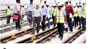
இது குறித்து, சென்னை மெட்ரோ ரயில் நிறுவன அதிகாரிகள் கூறுகையில், "இத்தடத்தில் மெட்ரோ ரயில் பாதா காப்பு ஆணையர் மற்றும் அவரது குழுவினர் ஆய்வு செய்தனர். இது அவர்களுக்கு திருப்திகரமாக இருந்தது. தானியங்கி முறையில் மெட்ரோ ரயில் ஒட்டுவது தொடர்பான நிகழ்வுக்கு (புரோகிராம்) ஓர் ஆவணம் தேவைப்படுகிறது. இதை 3வது நாள் வழங்க வேண்டும். இந்த ஆவணம் ஓரிரு நாட்களில் கிடைத்து விடும். அதன்பிறகு, பிப்.18ம் தேதி முதல் 21ம் தேதிக்குள் மீண்டும் பாதாகாப்பு ஆணையர் வந்து, சோதனை ஒட்டம் நடத்த திட்டமிடப்பட்டுள்ளது. இந்த மாதம் இறுதிக்குள் இந்த வழித்தடம் தயாராக இருக்கும். இவ்வாறு அவர்கள் கூறினர்.