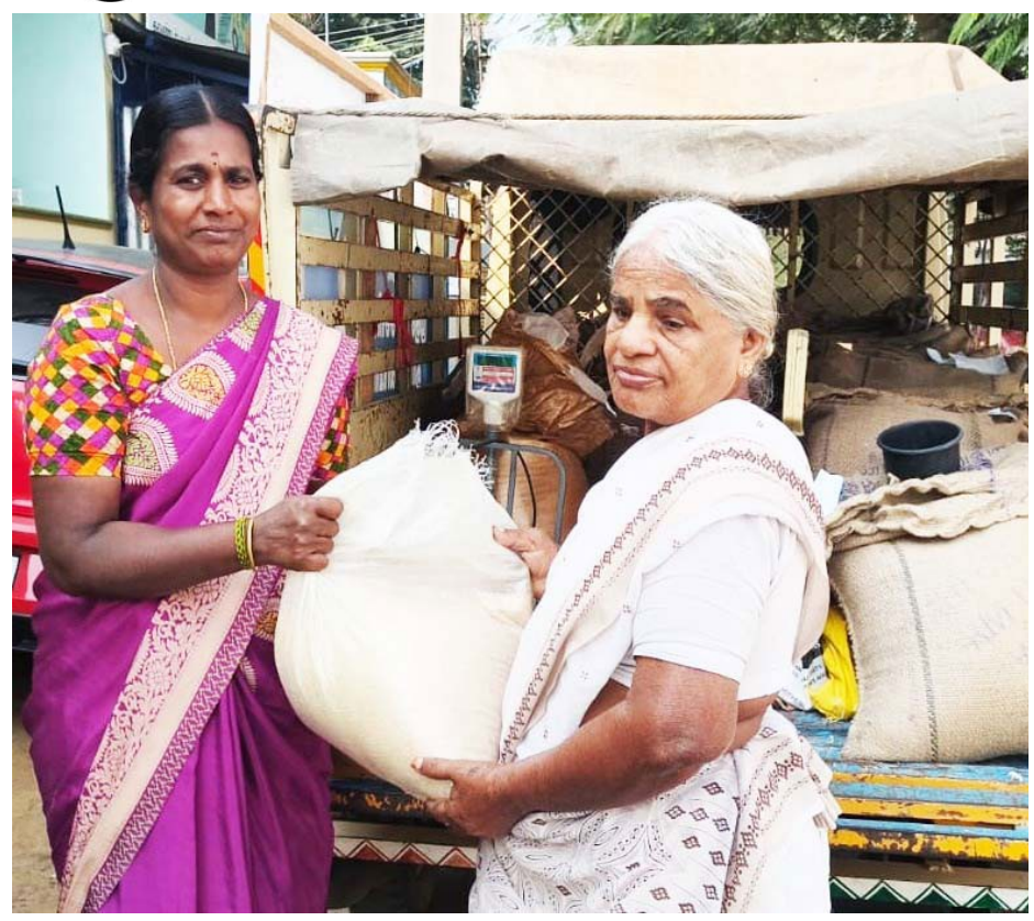
■ திருப்பூர் திருமுருகன்புண்டரிக் வீடு தேடி ரேஷன் பொருட்கள் வழங்கும் முதலமைச்சரின் தாயுமானவர் திட்டத்தின் கீழ், 70 வயதுக்கு மேற்பட்ட முதியவர்கள் மற்றும் மாற்றுத்திறனாளிகளின் வீடுகளுக்கு நேரடியாக ரேஷன் பொருட்கள், திருமுருகன்புண்டர் நியாய விலை கடைபில் இருந்து விநியோகம் செய்யப்பட்டது.