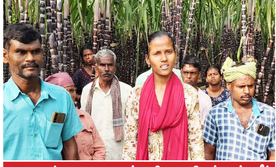
துறையூர் அருகே கரும்பு விவசாயிகள் கண்ணீர் கரும்பு கொள்முதல் தாமதம் ஏக்கருக்கு ரூ.1.5 லட்சம் நஷ்டம் ஏற்படும் என புகார்

திருச்சி, ஜன.5- திருச்சி மாவட்டம் துறையூர் அடுத்தள்ள பொன்னுச்சங்கம்பட்டி பகுதியில், விவசாயிகள் சுமார் 20 ஏக்கருக்கும் மேற்பட்ட பரப்பளவில் செங்கரும்பு பயிரிட்டுள்ளனர். தமிழக அரசு பொது விநியோகத் திட்டத்தின் கீழ், பொங்கல் பண்டிகையை முன்னிட்டு குடும்ப அட்டைதாரர்களுக்கு வழங்கப்படும் பொங்கல் தொகுப்பில் கரும்பு சேர்க்கப்பட்டு வந்தது. இதற்காக, இப்பகுதி விவசாயிகளிடமிருந்து கூட்டுறவு சங்கங்கள் மூலம் கரும்பு கொள்முதல் செய்யப்பட்டு வந்தது. கடந்த ஆண்டுகளில் டிசம்பர் 15ஆம் தேதிக்குள் கரும்பு கொள்முதல் செய்ய விவசாயிகளுடன் ஒப்பந்தம் செய்யப்பட்ட பெரும் குழப்பத்திலும் கவலை மீறும் ஆய்வு நடந்துள்ளது. கரும்பு கொள்முதல் தாமதமானால், ஏக்கருக்கு ரூ.1 லட்சத்து 50 ஆயிரம் வரை நஷ்டம் ஏற்படும் என தெரிவித்த விவசாயிகள், தமிழக அரசு உடனடியாக கரும்பை கொள்முதல் செய்ய நடவடிக்கை எடுக்க வேண்டும் என வலியுறுத்தியுள்ளனர்.