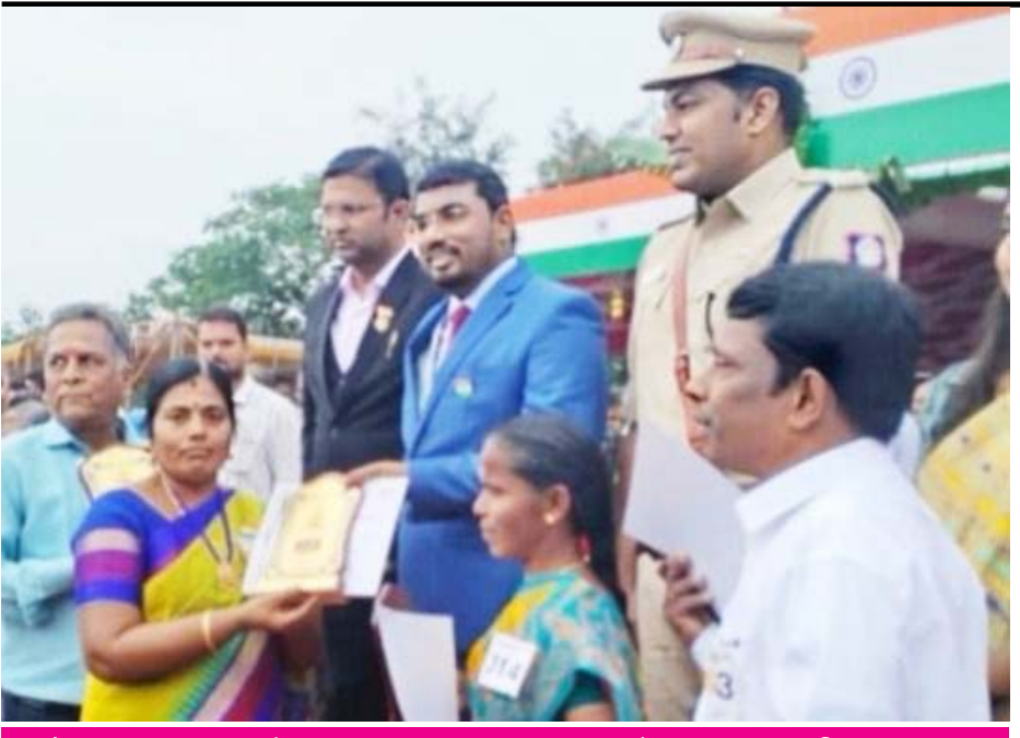
சின்னாளபட்டி சிறப்புநிலை பேரூராட்சி செயல் அலுவலர் இளவரசிக்கு விருது மற்றும் பாராட்டு சான்றிதழை மாவட்ட ஆட்சியர் வழங்கினார்

திடக்கழிவு மேலாண்மை திட்டம், பொது சுகாதாரம், குடிதண்ணீர் வசதி, தெருவிளக்கு வசதி, சாலை வசதி, வரிவசூலில் 100 சதவீதம் சாதனை