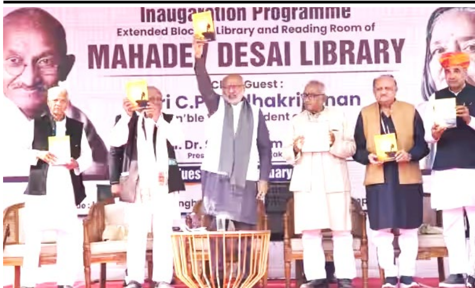
தேசத்திற்கு குஜராத் அளித்த பங்களிப்பு; மூன்று ஆளுமைகளை பாராட்டிய சிபிஆர்

புதுடி: ஜன.21- தேசத்திற்கு குஜராத் அளித்த பங்களிப்பு பாராட்டுக்குரியது. இந்தியாவிற்கு வழங்கிய மூன்று உயர்ந்த ஆளுமைகளுக்கு நன்றி என துணை ஜனாதிபதி சி.பி. ராதாகிருஷ்ணன் தெரிவித்தார். புதுடியில் உள்ள காந்தி ஆசிரமத்தில் உள்ள ஹரிஜன சேவக் சங்கத்திற்கு துணை ஜனாதிபதி சி.பி.ராதாகிருஷ்ணன் விஜயம் செய்தார். அவர் 'மஹாத்மா காந்தியின் பார்வை' என்ற தலைப்பில் புத்தகத்தை வெளியிட்டார். புத்தகம் நிகழ்ச்சியில் சி.பி.ராதாகிருஷ்ணன் பேசியதாவது: நூலகங்கள் சமூக மாற்றத்திற்கான கருவிகள். அறிவு குணம், மனசாட்சி மற்றும் சமூகப் பொறுப்பை வடிவமைக்கிறது. சமூகத்திற்கு ஹரிஜன சேவக் சங்கம் சிறப்பான சேவையை வழங்கி இருக்கிறது. மேற்கத்திய உடைகளை காந்தி கைவிட்டார். இந்த மாற்றம், மக்களுடன் அடையாளம் கண்டு அவர்களின் மேம்பாட்டிற்காக பாடுபடுவதில் காந்தியின் வாழ்நாள் அப்பணியை பகர்ந்து கொடுத்தார். அதற்குப் பதிலாக அவர் சாதாரண ஆதிக்கம். இந்தியாவின் முன்னாள் ஜனாதிபதி கே.ஆர். நாராயணனின் கல்வியை அவரது பயணத்தை வடிவமைப்பதிலும் ஹரிஜன சேவக் சங்கம் முக்கிய பங்கு வகித்தது. எதிர்காலத்தில் இது போன்ற பல முன்மாதிரியான நபர்களை சங்கம் தொடர்ந்து வளர்க்கும். சமூகத்திற்கு நேர்மையான சேவை செய்வது, பண்பும் மனசாட்சியும் கொண்ட நபர்களை உருவாக்குகிறது. தேசத்திற்கு குஜராத் அளித்த பங்களிப்பு பாராட்டுக்குரியது. நாட்டின் சுதந்திரத்திற்காக மகாத்மா காந்தி, தேசிய ஒற்றுமைக்காக சர்தார் வல்லபாய் படேல் மற்றும் நாட்டின் வளர்ச்சிக்கு பிரதமர் நரேந்திர மோடி என மூன்று ஆளுமைகளை குஜராத் மாநிலம் இந்த நாட்டிற்கு வழங்கியுள்ளது. இவ்வாறு சி.பி.ராதாகிருஷ்ணன் பேசினார்.