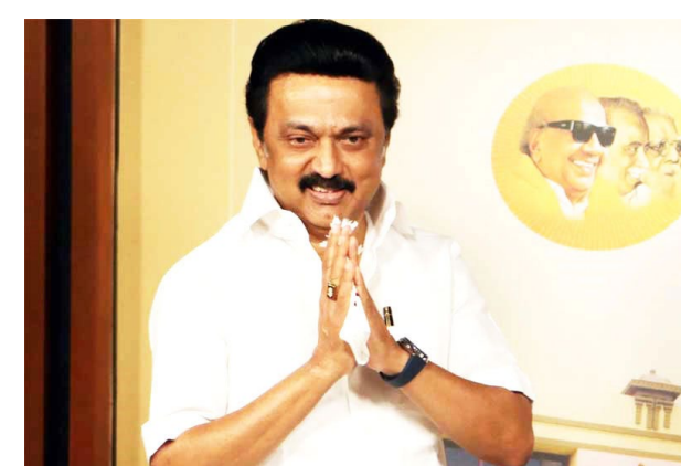
திருப்புவம் திராவிட மடல் அரசுதான். தீர்த்துக்கும் உறுதிக்கும் பெயர்பெற்ற

சென்னை: ஜன.8- நான்கரை ஆண்டுகளில் 4,000 கோயில் குடமுழுக்குகளை நடத்தி பக்தர்களின் அசைக்க முடியாத நம்பிக்கையைப் பெற்றுள்ள திராவிட மடல் அரசு என்று முதல்வர் ஸ்டாலின் பெருமிதத்துடன் கூறி உள்ளார்.