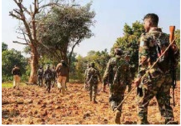
சுகுமா மாவட்டத்தில் நக்சலைட்டுகள் 26 பேர் தங்கள் ஆயுதங்களை ஒப்படைத்தனர்.

ராய்ப்பூர், ஜன.8- சத்தீஸ்கர், சுகுமா மாவட்டத்தில், நக்சலைட்டுகள் 26 பேர் சரணடைந்தனர். சத்தீஸ்கர், தெலுங்கானா, மஹாராஷ்டிரா, மத்திய பிரதேச மாநிலங்களில் ஒரு காலத்தில் நக்சல் ஆதிக்கம் மிகுந்து காணப்பட்டது. இதை ஒடுக்கும் வகையில் மத்திய மாநில அரசுகள் தீவிர முயற்சிகளை மேற்கொண்டு வருகின்றன. நாடு முழுவதும் மார்ச் மாதத்திற்குள் நக்சல் இயக்கத்தை முற்றிலும் அழிக்க நடவடிக்கை எடுக்கப்படும் என, பிரதமர் மோடி மற்றும் மத்திய உள் துறை அமைச்சர் அமித் ஷா அறிவித்துள்ளனர். இந்நிலையில், சத்தீஸ்கர் மாநிலம்