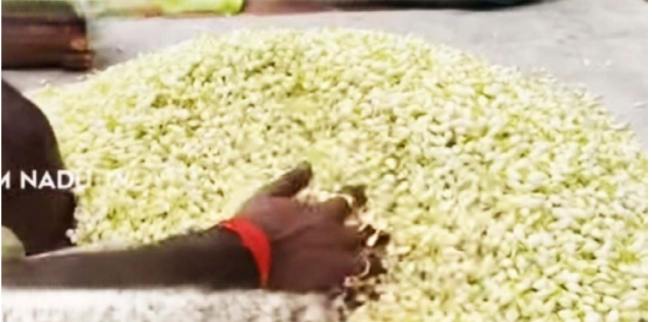
■ தென்காசி மாவட்டம் சங்கரன்கோவிலில் சுற்று வட்டார பகுதியில் ஏராளமான விவாயிகள் பூக்கள் உற்பத்தி செய்து வருகின்றனர் தற்போது ஒரு வார காலமாக தட்டவெட்டி நிலை காரணமாக பூக்கள் வரந்து குறைந்து காணப்படுகிறது இதனால் இன்று மல்லிகைப்பூ ஒரு கிலோ 3500 விற்பனை செய்யப்பட்டுள்ளது இதனால் விவாயிகள் பெரும் மகிழ்ச்சி அடைந்துள்ளனர்