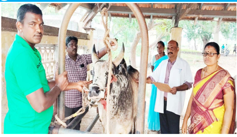
கலந்துகொண்டு ஜல்லிக்கட்டு காளைக்கு கொம்பு, திமிலு, பல்லு