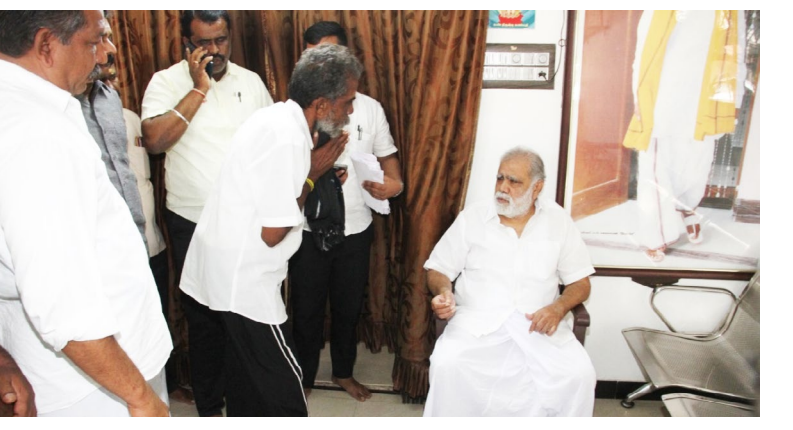
ஊராட்சியை சேர்ந்த பொதுமக்கள் மற்றும் கட்சி நிர்வாகிகள் தங்கள் ஊராட்சி பகுதியில் 100 நாள் வேலைத்திட்டப் பணிகளில் குளறுபடிகள் இருப்பதாகவும், முன்னாள் ஊராட்சி பிரதி நிதிகள் 100 நாள் வேலைத்திட்டப் பணிகளில் தலைவீட்டு செய்ததாகவும், அமைச்சரிடம் புகார் செய்தனர். உடனடியாக அமைச்சர் ஐ.பெரியசாமி அவர்கள், ஊரக வளர்ச்சித் திட்டப் பணிகளில் எந்த குளறுபடியும் நடைபெறாது. இதைத் தவிர மத்திய அரசில் நிதி வழங்காவிட்டாலும், மாநில அரசு கிராமப்புற ஏழை மக்களின்

சின்னாளப்படி, டிசு.6- ஆத்தூர் தொகுதியில் மகாத்மா காந்தி தேசிய ஊரக வேலை திட்டப்பணிகளை அதிகாரிகள் கண்காணித்து முறையாக அனைவருக்கும் வழங்க நடவடிக்கை எடுக்க வேண்டும் என்று அமைச்சர் ஐ.பெரியசாமி உத்தரவிட்டுள்ளார். திண்டுக்கல் மாவட்டம் ஆத்தூர் சட்டமன்ற தொகுதி தீமுக உறுப்பினரும், தீமுக மாநில துணை பொதுச்செயலாளரும், ஊரக வளர்ச்சித்துறை அமைச்சருமான ஐ.பெரியசாமி அவர்களிடம் ஆத்தூர் தொகுதியைச் சேர்ந்த பொது மற்றும் கோரிக்கை மனுக்களைப் பெற்று உடனடியாக சம்மந்தப்பட்ட அதிகாரிகளை தொடர்பு கொண்டு பொதுமக்களின் கோரிக்கைகளை நிறைவேற்ற உத்தரவிட்டார். அப்போது ஆத்தூர் தொகுதியைச் சேர்ந்த பொதுமக்கள் ஒரு சிலர் தங்களுக்கு இலவச வீட்டு மனைப்பட்டா வேண்டுமென்றும், கலைஞரின் கனவு இல்லத்தை திட்டம் மூலம் வீடுகள் வழங்க வேண்டும் என கோரிக்கை மனு கொடுத்தனர். அதனைத் தொடர்ந்து புதுச்சேரி