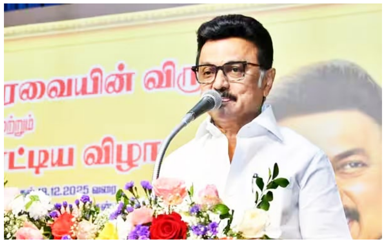
நாட்டு மக்களுக்குத் தவறான செய்தியையே கொண்டு சேர்க்கும்.

சென்னை: டிச.26- சிறுபான்மையினர் அச்சமின்றி வாழத் துணையிருப்பதில் தான் பெரும்பான்மையினரின் பலமும் இருக்கிறது; குணமும் இருக்கிறது. பெரும்பான்மை என்ற பெயரில் சில வலதுசாரி வன்முறைக்கும்பல்கள் தாக்குதல்களிலும் கலவரங்களிலும் ஈடுபடுவது, அதுவும் பிரதமர் மோடி கிறிஸ்துமஸ் விழா வில் பங்கெடுக்கும்போதே ஈடுபடுவது, மனிப்பூர் கலவரங்களைத் தொடர்ந்து, இப்போது ஜபல்பூர் ராய்பூர் மற்றும் பிற இடங்களிலும்