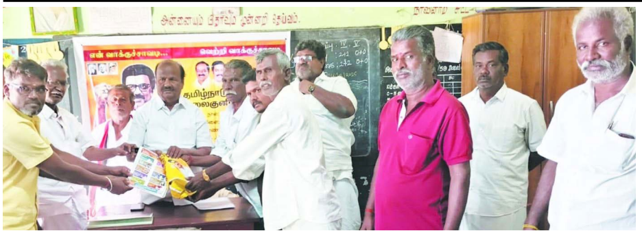
தமிழ்நாட்டை தலைகுனிய விடமாட்டோம், வாக்குச்சாவடி முகவர்களுக்கான ஆலோசனைக் கூட்டம்