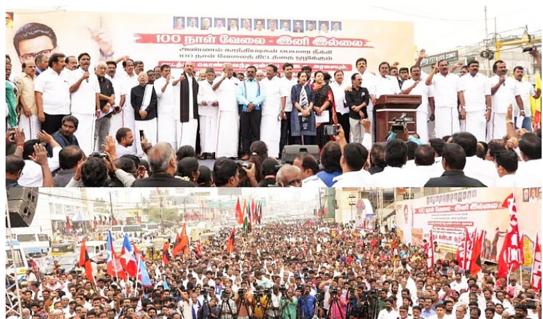
என்பதை அண்ணல் காந்தியின் மீது வெறுப்புணர்வோடு செயல்படும் ஒன்றிய பா.ஜ.க. ஆட்சியாளர்கள் உரை வேண்டும். ஏழைகளின் வாழ்வாதாரத்தை உறுதிசெய்ய வேண்டும்” என்று அவர் தெரிவித்துள்ளார்.

சென்னை: டிசு.25- மகாத்மா காந்தி ஊரக வேலை திட்டத்தை மீட்டுக்க, 389 இடங்களில் ஏழை விவசாயக் கூலித் தொழிலாளர்கள் திரண்டு ஆர்ப்பாட்டத்தில் பங்கேடுத்ததாக முதல்வர் ஸ்டாலின் தெரிவித்துள்ளார். இது குறித்து அவர் தனது எக்ஸ் தளத்தில் வெளியிட்ட பதிவில், “மகாத்மா காந்தி ஊரக வேலை திட்டத்தை (MGNREGA) மீட்டுக்கவும், தங்களுது வாழ்வாதாரத்தைக் காத்துக்கொள்ளவும் தமிழ்நாடு முழுவதும் 389 இடங்களில் ஏழை விவசாயக் கூலித் தொழிலாளர்கள் திரண்டு ஆர்ப்பாட்டத்தில் பங்கேடுத்தனர். இது தமிழ்நாட்டில் இருந்து ஒலிக்கும் ஒட்டுமொத்த இந்திய விவசாயிகளுக்கான குரல்