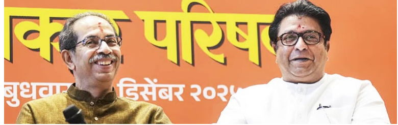
செய்துள்ளன. இதற்கான அறிவிப்பு மும்பையில் இன்று வெளியிடப்பட்டது. மும்பையில் செய்தியாளர்களை கூட்டாகச் சந்தித்த உத்தவ் தாக்கரே மற்றும் ராஜ் தாக்கரே ஆகியோர் இதற்கான அறிவிப்பை வெளியிட்டனர். செய்தியாளர்களிடம் பேசிய ராஜ் தாக்கரே, “இன்று நாங்கள் எங்கள் இருவருக்கும் இடையேயான கூட்டணியை அறிவிக்கிறோம். தேர்தலை இணைந்து எதிர்கொள்வோம். மும்பை மேயர் ஒரு மராத்தியராக இருப்பார். அவர் எங்கள் கட்சிகள் இரண்டு கட்சிகளில் ஏதேனும் ஒன்றைச் சார்ந்தவராக இருப்பார். மேலும், நாங்கள் சரத் பவாருடன் பேச்சுவார்த்தை நடத்தி வருகிறோம்” என தெரிவித்தார். உத்தவ் தாக்கரே பேசும்போது, “நாங்கள் ஒன்றாக இருப்பதற்காக இணைந்துள்ளோம். மும்பையை

மும்பை: டிசு.25- ஜனவரி 15ம் தேதி நடைபெற உள்ள மகாராஷ்டிர உள்ளாட்சித் தேர்தலை இணைந்து எதிர்கொள்ளப் போவதாக சிவ சேனா (உத்தவ் தாக்கரே), மகாராஷ்டிரா நவநிர்மாண் சேனா ஆகியவை கூட்டாக அறிவித்துள்ளன. மகாராஷ்டிராவின் முக்கிய மாநில கட்சிகளாக சிவ சேனா (யுபிடி), மகாராஷ்டிரா நவநிர்மாண் சேனா ஆகியவை விளங்கி வருகின்றன. உத்தவ் தாக்கரேவுக்கும் ராஜ் தாக்கரேவுக்கும் இடையே இருந்த பகை காரணமாக இரு கட்சிகளும் தனித்தே போட்டியிட்டு வந்தன. இந்நிலையில், வரக்கூடிய மகாராஷ்டிர உள்ளாட்சித் தேர்தலை கூட்டணி அமைத்து எதிர்கொள்வது என இவ்விரு கட்சிகளும் முடிவு