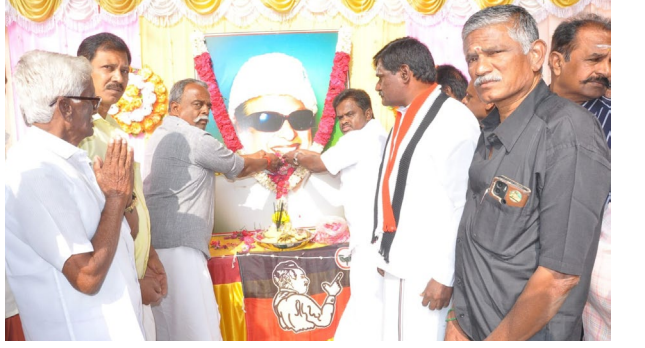
எம்ஜிஆர் அவர்களின் 38 ஆம் ஆண்டு நினைவு தினம்

செய்தனர். இதில் ஒட்டன்சத்திரம் நகர தலைமை நிர்வாகிகள், ஒட்டன்சத்திரம் ஒன்றியம், தொப்பம்பட்டி ஒன்றியம், மாவட்ட மகளிரணி, நகர வார்டு செயலாளர்கள், இளைஞரணி நிர்வாகிகள் மற்றும் கிளை கழக செயலாளர்கள் அனைவரும் கலந்துகொண்ட