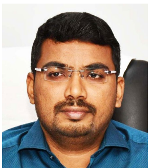
தொகுதியில் 41 ஆயிரத்து 850 வாக்காளர்கள், நத்தம் சட்டமன்ற

திண்டுக்கல், டிச.20- சட்டமன்ற தொகுதியில் 60 ஆயிரத்து 493 வாக்காளர்கள், பழனி சட்டமன்ற தொகுதியில் 52ஆயிரத்து 174 வாக்காளர்கள், ஒட்டன்சத்திரம் சட்டமன்ற தொகுதியில் 34 ஆயிரத்து 127 வாக்காளர்கள், ஆத்தூர் சட்டமன்ற தொகுதியில் 48 ஆயிரத்து 145 வாக்காளர்கள், நிலக்கோட்டை சட்டமன்ற