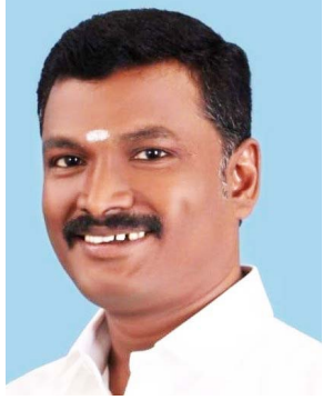
க கழக கூட்டணிக்கு ஆதரவளித்தோம்.

சென்னை, டிச.20- ஜனநாயக மக்கள் நீதி கழகத்தின் தலைவர் இன்று வெளியிட்ட அறிக்கையில் நடந்து முடிந்த 2024 பாராளுமன்ற தேர்தலில் தமிழ்நாடு முன்னாள் முதலமைச்சர் இன்றைய எதிர்க்கட்சித் தலைவர் புரட்சித் தமிழர் எடப்பாடி திரு கே பழனிச்சாமி அவர்கள் தலைமையிலான அனைத்திந்திய அண்ணா திராவிட முன்னேற்ற