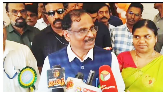
சிறப்பாக நடைபெறுகின்றன. ராக்கெட் ஏவுதலின்போது ஏதேனும் சிக்கல் ஏற்பட்டால், விண்வெளி வீரர்களின் உயிரைப் பாதுகாக்க, அவர்களைப் பத்திரமாக வெளியேற்றும் அமைப்பின் பணியும் மிகவும் வெற்றிகரமாக முடிந்துள்ளது. இத்திட்டத்துக்காகக் கிட்டத்தட்ட 8,000 பரிசோதனைகள்

முலம் இந்திய விண்வெளி வீரர்களை விண்ணுக்கு வெற்றிகரமாக அனுப்பி, அவர்களைப் பத்திரமாகத் திரும்பக் கொண்டு வருவதே இத்திட்டத்தின் நோக்கமாகும். ககன்யான் திட்டத்துக்கான ராக்கெட் தயாரிப்புப் பணிகள் முழு அளவில் நடந்து வருகிறது. விண்வெளியில் விண்வெளி வீரர்களுக்குத் தேவையான வெப்பநிலை, அழுத்தம், காப்பன்டை ஆகியவை, ஆக்ஸிஜன் மற்றும் ஈரப்பதம் ஆகியவற்றைக் கட்டுப்படுத்தும் அமைப்பின் மேம்பாட்டுப் பணிகளும்