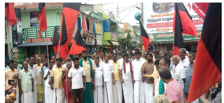
கொண்டாடப்பட்டது. உள்ள பொதுமக்கள் மற்றும் கட்சி நிர்வாகிகளுக்கு சிக்கன் பிரியாணி தொடர்ந்து அப்பகுதியில்

தேனி நவ.28 தேனி மாவட்டம் தேவாரம் பேரூர் திருமக மற்றும் இளைஞர் அணி சார்பில் பிறந்தநாள் விழா வெகு சிறப்பாக கொண்டாடப்பட்டது. திருமக கட்சி நிர்வாகிகள் இளைஞர் அணிகள் திரளாக கலந்து கொண்டு மைதானம் அருகில் இருந்து ஊர்வலமாக தேவாரம் காவல் நிலையம் அருகே வந்தடைந்தனர். பின்னர் பிறந்தநாள் விழா நிகழ்வாக கேக் வெட்டி இனிப்புகள் வழங்கியும்