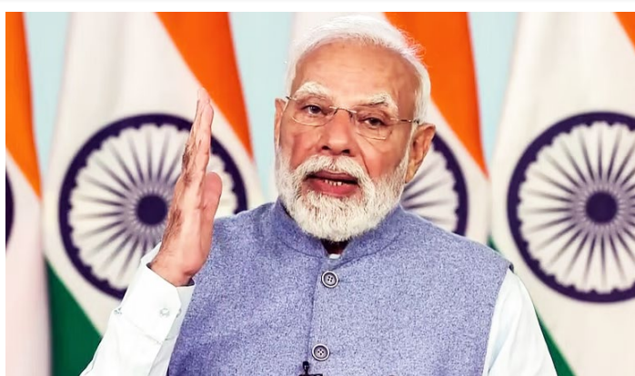
இது நமக்கு உரிமையை வழங்குவதோடு மட்டுமல்லாமல், குடிமக்களாக நமது கடமைகளையும் நினைவூட்டுகிறது. இவற்றை நிறைவேற்ற

இதன்படி, அரசியலமைப்பு தினம் நேற்று நாடு முழுவதும் கடைபிடிக்கப்பட்டது. இத்தொடர்பு பிரதமர் நரேந்திர மோடி தனது எக்ஸ் சமூக வலைதள பக்கத்தில், "அரசியலமைப்பு தினத்தில் அரசியலமைப்பை வடிவமைத்தவர்களுக்கு மரியாதை செலுத்துவோம். அவர்களின் தொலைநோக்குப் பார்வை, வளர்ந்த இந்தியாவை உருவாக்க வேண்டும் என்ற நமது முயற்சியை தொடர்ந்து ஊக்குவிக்கிறது. நமது அரசியலமைப்பு சட்டம், கண்ணியம், சமத்துவம் மற்றும் சுதந்திரத்துக்கு மிகுந்த முக்கியத்துவம் அளிக்கிறது.