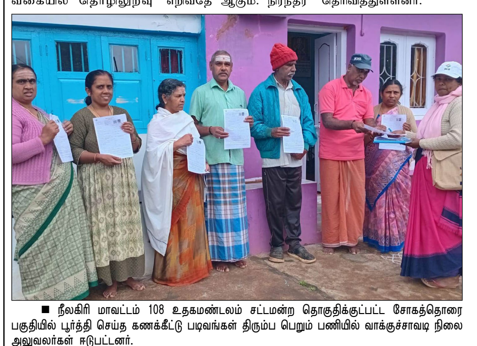
■ நீலகிரி மாவட்டம் 108 உதகமண்டலம் சட்டமன்ற தொகுதிக்குட்பட்ட சோகத்தொரை பகுதியில் புரட்சி செய்த கணக்கீட்டு படிவங்கள் திரும்ப பெறும் பணியில் வாக்குச்சாவடி நிலை அலுவலர்கள் ஈடுபட்டனர்.

இக்கூட்டத்தில் 2026 சட்டப்பேரவை தேர்தலை எப்படி எதிர்கொள்வது, கூட்டணி கட்சிகளை எப்படி அணுகுவது என்பது குறித்து ஆலோசிக்கப்பட்டது. பிறார் தேர்தலில் பாஜக கூட்டணி எப்படி வெற்றி பெற்றது என்பது அனைவருக்கும் தெரியும். அந்த வெற்றியே தேர்தல் ஆணையத்தால் திட்டமிடப்பட்ட கட்டமைக்கப்பட்டது. அந்த தேர்தலில் தேர்தல் ஆணையம் பிறார் மக்களை தோற்கடித்தது. அதேபோல, அந்தேர்தல் நடக்க விடாமலாம். தமிழக மக்களை தேர்தல் ஆணையம் தோற்கடிக்க விடாமலாம். இவ்வாறு அவர் கூறினார்.