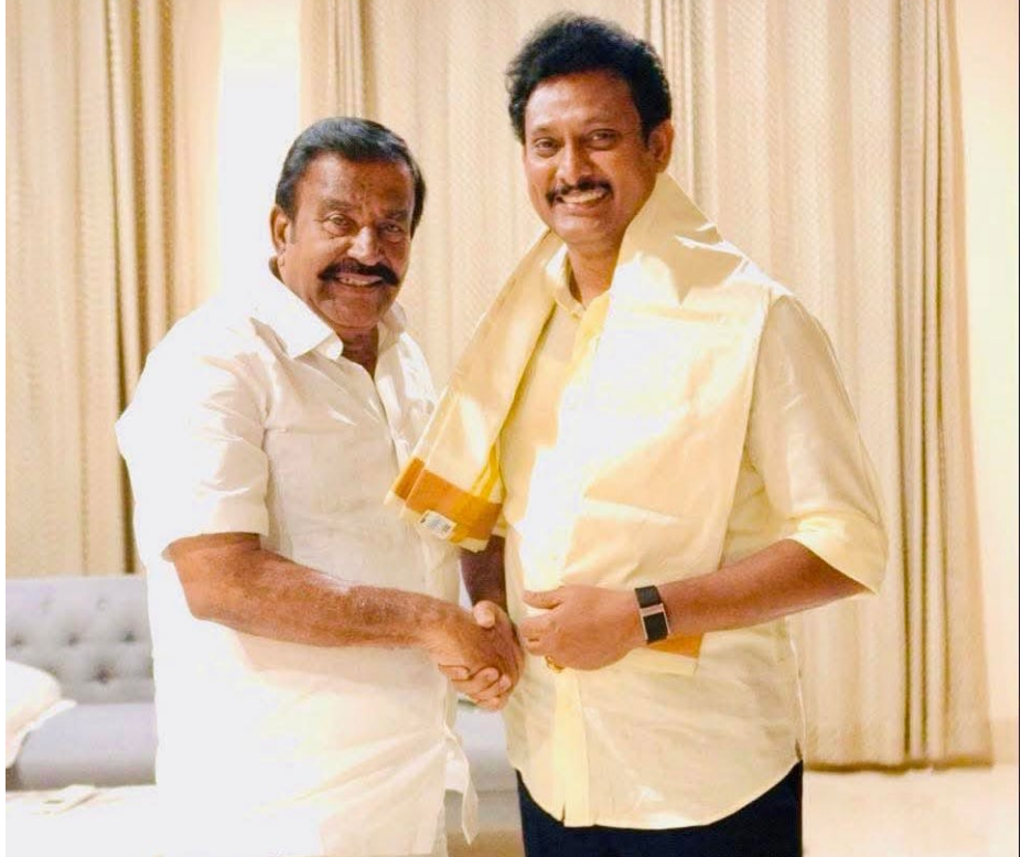
■ நகராட்சி நிர்வாகத்துறை அமைச்சர் கே.என்.நேருவிடம் பள்ளிக் கல்வித்துறை அமைச்சர் அன்பில் மகேஸ் பொய்யாமொழி முனைவர் பட்டம் பெற்றதற்காக நேரில் சந்தித்து வாழ்த்துகளை பெற்ற காட்சி.

முன்று வேளாண் சட்டங்களை மண்டி போட்டு ஆதரித்த பழனிசாமி, ஒருமுறையாவது தலையைச் சற்று நிமிர்த்தி நமது விவசாயிகளின் கோரிக்கைகளைக் கேட்கச் சொல்லியாவது சொல்வாரா? விவசாயிகள் நலன் காக்கத் தமிழ்நாடு ஒற்றுமையாகக் குரல் கொடுக்க வேண்டும் என்பதால்தான் இத்தனையும் கேட்கிறேன். இரத்தத்தை வியர்வையாகச் சிந்தி விவசாயிகள் உழைத்த உழைப்பு வீணாகக் கூடாது!" இவ்வாறு அவர் தெரிவித்துள்ளார்.