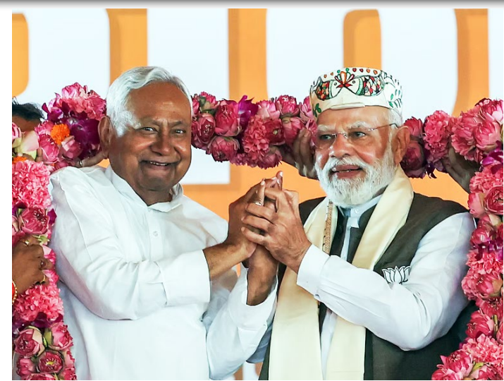
தொகுதிகளிலும் காங்கிரஸ் 6 தொகுதிகளிலும் இதர கட்சிகள் 9 தொகுதிகளிலும் முன்னிலைப் பெற்று ஒட்டுமொத்தமாக 51 தொகுதிகளில் முன்னிலையில் உள்ளன. எனவே, பிகாரில், 2020 தேர்தல்

செய்யப்பட்டுள்ளது. பாஜக மட்டும் 85க்கும் மேற்பட்ட தொகுதிகளில் முன்னிலையில் உள்ளது. பிகாரில் நடந்த பேரவைத் தேர்தலில் பதிவான வாக்குகள் இன்று காலை முதல் எண்ணப்பட்டு வாக்கு எண்ணிக்கை முடிவுகள் வெளியாகி வருகின்றன. வாக்கு எண்ணிக்கை தொடங்கியது முதலே தேசிய ஜனநாயகக் கூட்டணி முன்னிலையில் உள்ளது. முற்பகல் 12 மணி நிலவரப்படி தேசிய ஜனநாயகக் கூட்டணியில் இடம்பெற்றுள்ள ஜனதா தளம் 73 தொகுதிகளிலும், பாஜக 84 தொகுதிகளிலும் இதர கட்சிகள் 31 தொகுதிகளிலும் முன்னிலை பெற்று சுமார் 188 தொகுதிகளில் தொடர்ந்து முன்னிலை வகித்து வருகின்றன. மகாகதப்பந்தன் கூட்டணியில் ராஷ்டிரிய ஜனதா தளம் 36