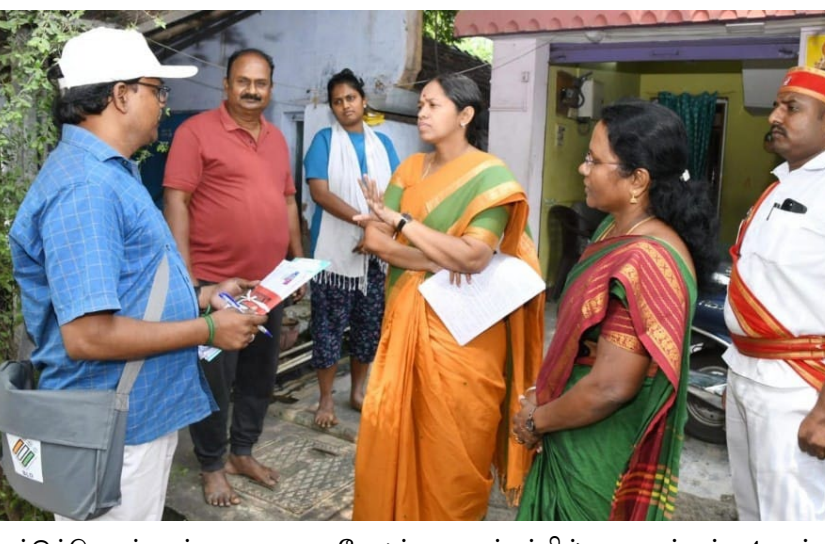
கேட்டுக்கொண்டார். சேலம் மாவட்டத்தில் நவம்பர் 4ஆம் தேதி