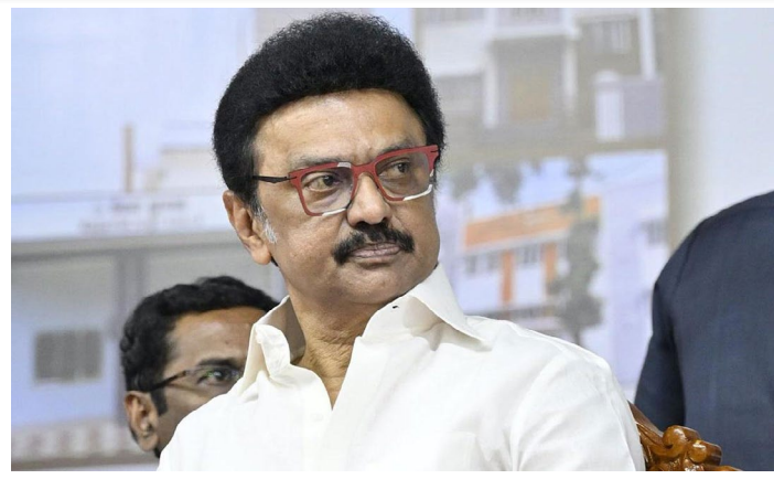
அங்கு வந்த இலங்கை கடற்படையினர் எல்லை தாண்டி மீன்பிடித்ததாகக் கூறி 14 மீனவர்களையும், படகுடன் கைது செய்து, இலங்கை மயிலடி மீன்பிடி துறைமுகத்

நேற்று முன்தினம் நள்ளிரவு மீண்டும் படகு பழுதடைந்து கடலில் தத்தளித்த நிலையில்,