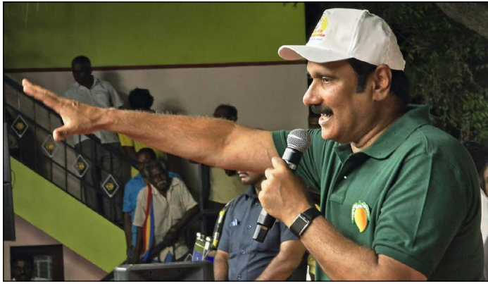
சமீப காலம் செய்யப்பட்டு வருகின்றன.

தமிழ்நாட்டில் சாயப்பட்டறைகள் செயல்படும் எந்த பகுதியிலும் அவற்றின் கழிவு நீர் முறையாக சுத்திகரிக்கப்படுவதில்லை. கட்டுவாரப்பகுதிகளிலும், ஆற்றங்கரைகளிலும் அமைந்திருக்கும் சாயப்பட்டறைகளின் கழிவு நீர் அரைகுறையாக சுத்திகரிக்கப்பட்டு ஆறுகளிலும், கடல்களிலும் கலக்கப்பட்டு கிடைக்கிறது. காவிரி, தென்பெண்ணை, பவானி, அமராவதி, நொய்யல் உள்ளிட்ட பல ஆறுகள் சாயப்பட்டறை கழிவுகளால் தான் கொஞ்சம், கொஞ்சம்