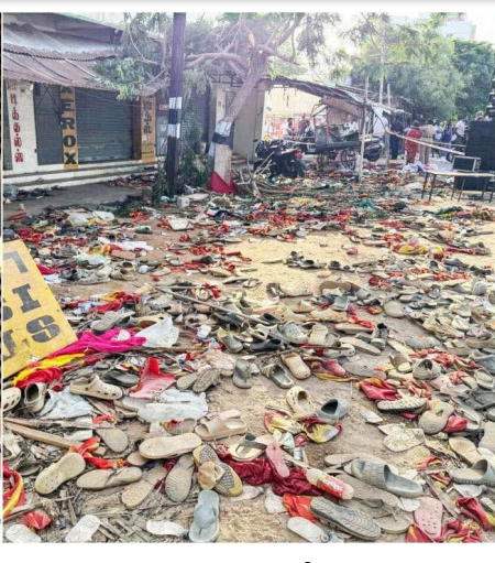
மக்களுக்கு நான் உறுதியளிக்கிறேன். அனைத்து மட்டங்களிலும் பொறுப்பு

உறுதி செய்யப்படும். பலவற்றிலும் இந்தியாவுக்கே முன்னோடியான தமிழ்நாடு, கூட்ட நெரிசல் விபத்துகளைத் தவிர்ப்பதிலும் நாட்டுக்கு வழிகாட்டும். மாநிலம் முழுவதும் துறைசார் வல்லுநர்கள், அரசியல் கட்சியினர், செயற்பாட்டாளர்கள், பொதுமக்கள் என அனைவரோடும் கலந்தாலோசித்து ஒரு முழுமையான 'நிலையான வழிகாட்டு நெறிமுறைகளை (SOP) வடிவமைப்போம். தமிழ்நாட்டுக்கு மட்டுமல்ல, ஒட்டுமொத்த இந்தியாவும் பின்பற்றத்தக்க மாடலாக இது அமையும்.