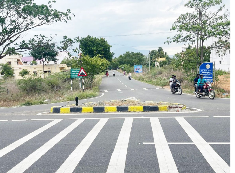
பிரிவு, முருகம்பட்டி பிரிவு பகுதியில் இருபுற சாலைகளை பாதுகாக்க கட்டப்படும் திருச்சுக்கர வாகனங்களை திருப்பு வதற்கும் தேசிய நான்கு வழிச்சாலை நிர்வாகம்

சின்னாளபட்டி, அக்.04 திண்டுக்கல் மதுரை தேசிய நான்கு வழி நெடுஞ்சாலையில் சின்னாளபட்டி பைபாஸ்சாலையில் சோலார் விளக்குகள் அமைக்க வேண்டும் என்று பொதுமக்கள், வாகன ஓட்டுனர்கள் கோரிக்கை விடுத்துள்ளனர். பைபாஸ் சாலை சந்திப்பில் விளக்குகள் இல்லாததால் தினசரி விபத்துகள் நடக்கும் அவலநிலை ஏற்பட்டுள்ளது. திண்டுக்கல் லி ருந்து மதுரை செல்லும் தேசிய நான்கு வழி நெடுஞ்சாலையில் தோமையாப்புரம், அண்ணாமலையார் மில், சிறுநாயக்கன்பட்டி பிரிவு, கலிக்கம்பட்டி பிரிவு, செட்டியப்படி பிரிவு, சின்னாளபட்டி புறநகர் பிரிவு, காந்திகிராமம், அம்பாத்துரை