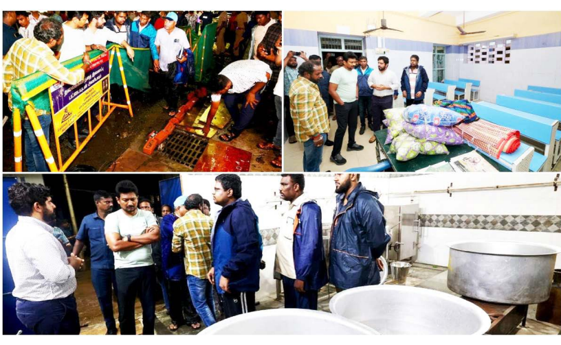
கூடம் மற்றும் தற்காலிக நிவாரண மையங்களில் பொதுமக்களுக்கு

சென்னை: அக்ட.23- சேப்பாக்கம் திருவல்லிக்கேணி சட்டப்பேரவை தொகுதிக்குட்பட்ட பகுதிகளில் வடகிழக்கு பருவமழையையொட்டி அமைக்கப்பட்டுள்ள மைய சமையல் கூடம் மற்றும் தற்காலிக நிவாரண மையங்களில் பொதுமக்களுக்கு தேவையான அடிப்படை வசதிகள் குறித்து அதிகாலையில் துணை முதல்வர் உதயநிதி ஸ்டாலின் திமர் ஆய்வு மேற்கொண்டார். இது குறித்து அரசு சார்பில் வெளியிடப்பட்ட அறிக்கையில், வடகிழக்கு பருவமழையை ஒட்டி அமைக்கப்பட்டுள்ள மைய சமையல்