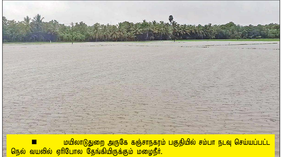
மயிலாடுதுறை அருகே கஞ்சாநகரம் பகுதியில் சம்பா நெடி செய்யப்பட்ட நெல் வயலில் ஏரிபோல தேங்கியிருக்கும் மழைநீர்.

நேரடி நெல் கொள்முதல் நிலையத்தில் தினமும் 2,000 மூட்டைகள் கொள்முதல் செய்வதாக அரசு அறிவித்து இருந்தது. ஆனால், நேரடியாக விவசாயிகளிடம் கேட்ட போது வெறும் 800 மூட்டைகள் தான் கொள்முதல் செய்வதாக தெரிவிக்கின்றனர். தமிழக அரசு தவறான தகவலை கூறி விவசாயிகளை ஏமாற்றுகிறது, எனவே, விவசாயிகளுக்கு இந்த தீபாவளி கண்ணீர் தீபாவளியாக தான் உள்ளது" என்றார்.