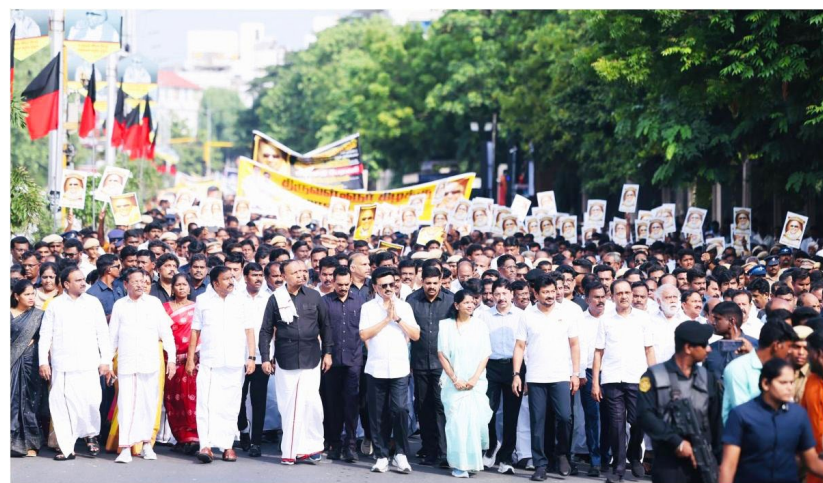
பதாகை உள்ளிட்டவற்றை ஏந்தியபடி நினைவிடத்தில் நிறைவு பெற்றது. அங்குள்ள முன்னாள் முதல்வர் பேரணியானது, மெரினா மறைந்த அண்ணாதுரை, கருணாநிதி

முதல்வர் மு.க.ஸ்டாலின் தலைமை வகித்தார். அவர், ஓமந்தூரார் வளாகத்தில் அமைந்துள்ள கருணாநிதி சிலையின் கீழ் வைக்கப்பட்டிருந்த உருவப் படத்துக்கு மலர் தூவி மரியாதை செலுத்தினார். பின்னர் திருமக பொதுச்செயலாளரும் அமைச்சருமான துரைமுருகன், துணை பொதுச்செயலாளர் கனிமொழி எம்.பி., உள்ளிட்டோர் மரியாதை செலுத்தியதைத் தொடர்ந்து பேரணி தொடங்கியது. முதல்வர் மு.க.ஸ்டாலின் முன்செல்ல அவரது பின்னால் திருமக நிர்வாகிகள், தொண்டர்கள், பொதுமக்கள் என திரளாளோர் கருணாநிதியின் புகைப்படம் ஏந்திய